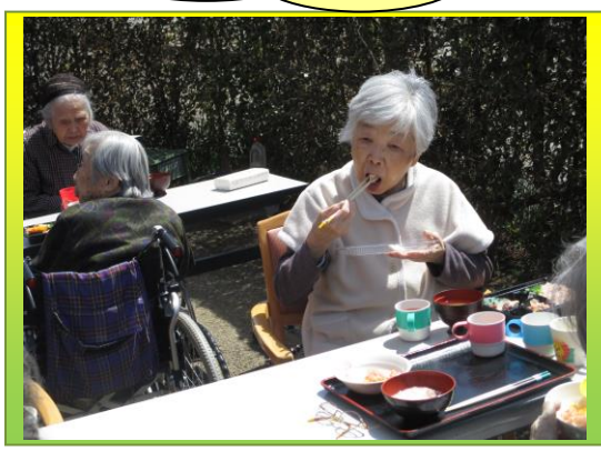
「どれも美味しいわ」とパクパ ク食べておられました。