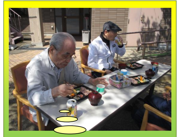
「ビールは最高だね」と男性陣 にはまた格別な日でした。