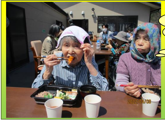
陽射し眩しく最高の日和 外でのお弁当は美味しかった