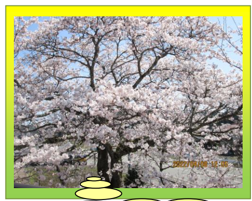
今年も綺麗に咲いてくれた 桜の木に感謝です。