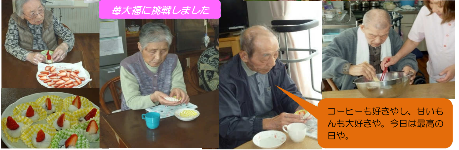
コーヒーも好きやし、甘いもんも大好きや。今日は最高の日や。